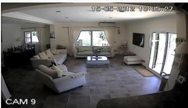
Imagen 1: Captado a las 10:35 AM con luz natural