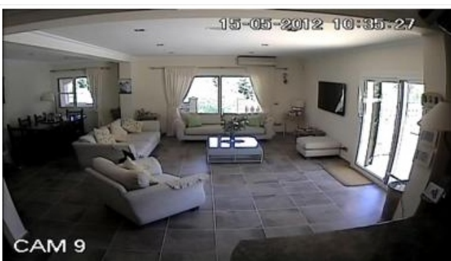
Imagen 1: Captado a las 10:35 AM con luz natural