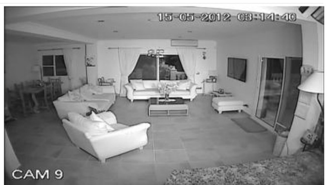
Imagen 2: Captado a las 03:14 AM a oscuridad completa